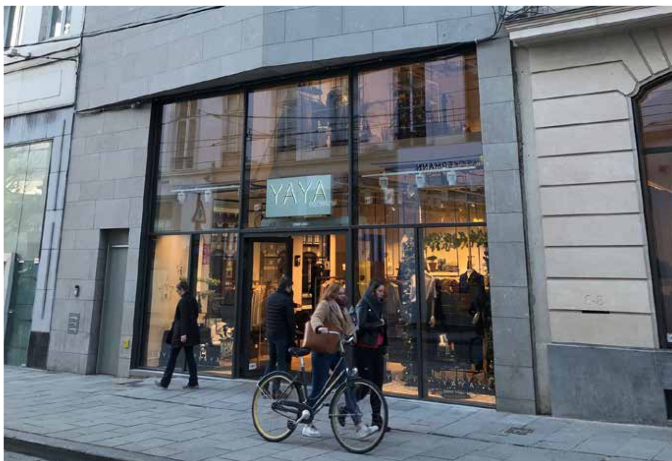
Gent Zonnestraat • YAYA

Op 30 juni 2021 bestaat 89% van de opgenomen kredietlijnen uit financieringen met een vaste rentevoet of gefixeerd door middel van renteswaps. De overige 11% zijn kredieten met een variabele rentevoet.