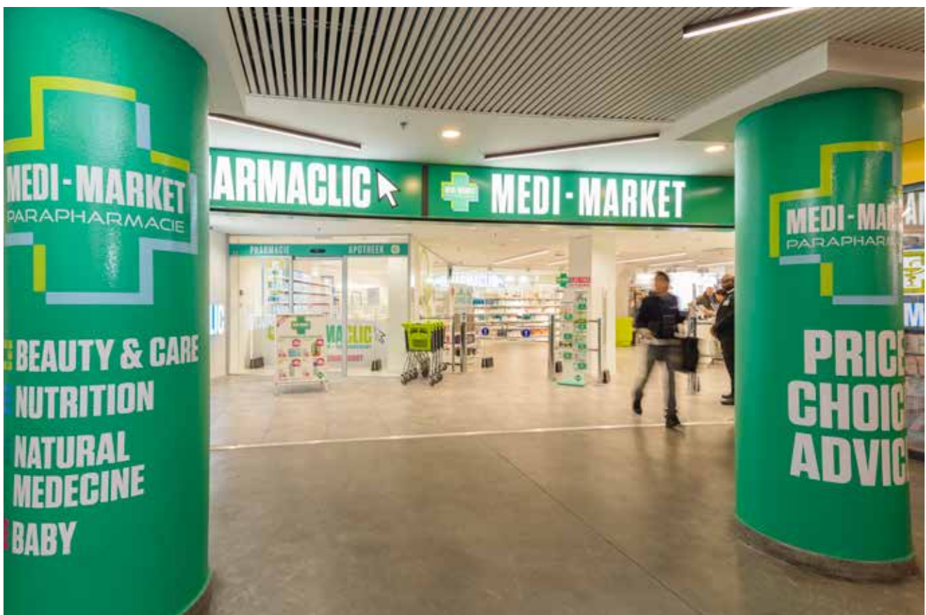
Brussel Elsensesteenweg • Medi Market

Behoudens onverwachte evoluties zoals faillissementen van belangrijke huurders, onvoorziene rentestijgingen of nieuwe maatregelen ter bestrijding van de COVID-19 pandemie, verwacht Vastned Belgium voor boekjaar 2021 een EPRA resultaat per aandeel tussen € 2,40 en € 2,50.